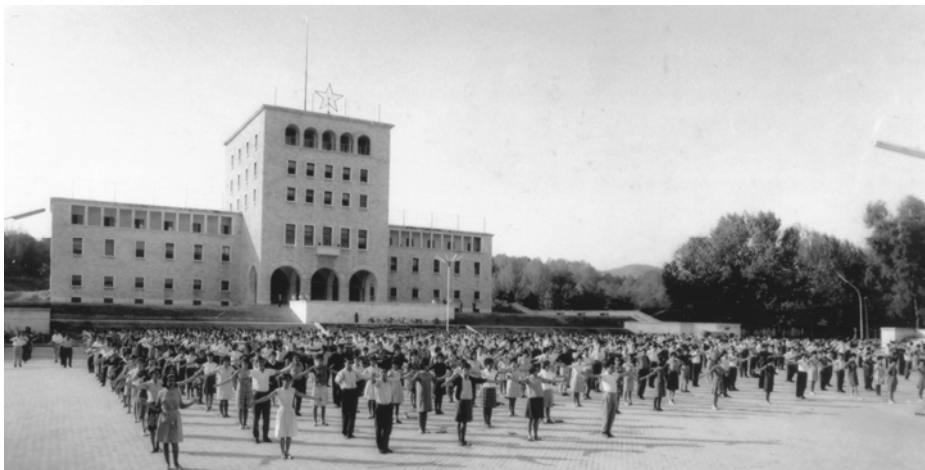
Gjinnastikë mëngezi, 1970