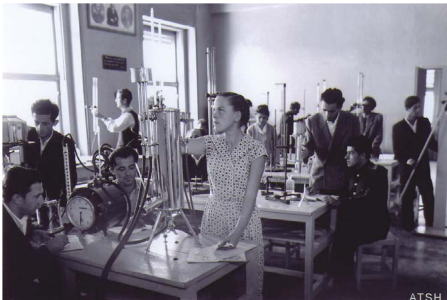
Seancë laboratorike në fizikë, viti shkollor 1957-58