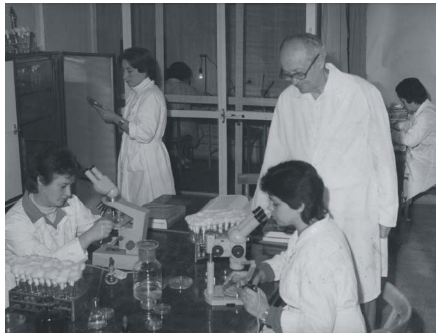
Çaste kërkimore në laboratorin e mikrobiologjisë ushqimore, 1987