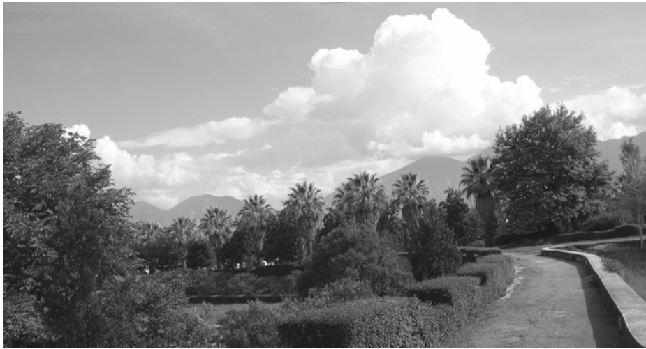
Kopshti Botanik i Tiranës, 2006