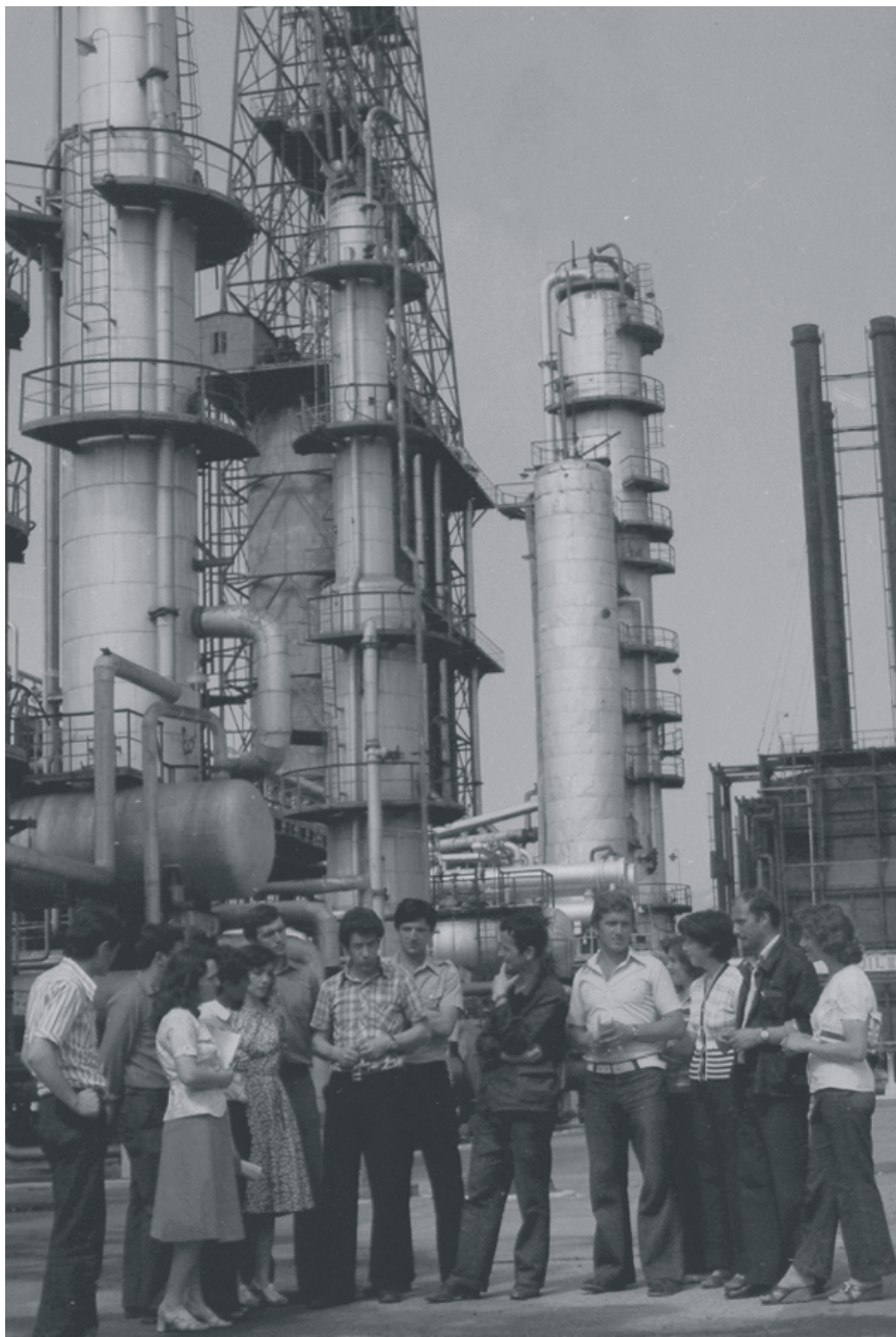
Praktikë profesionale në Uzinën e Përpunimit të Thellë të Naftës, Ballsh, 1976