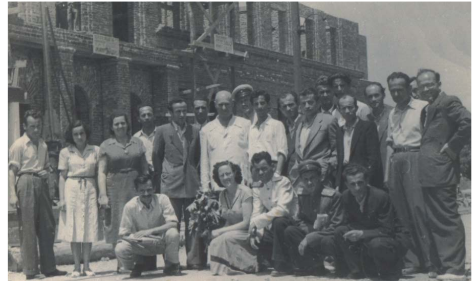
Trupa mësimore e Institutit Pedagogjik, qershor 1953