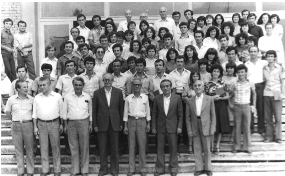
Pas një ceremonie, 1985