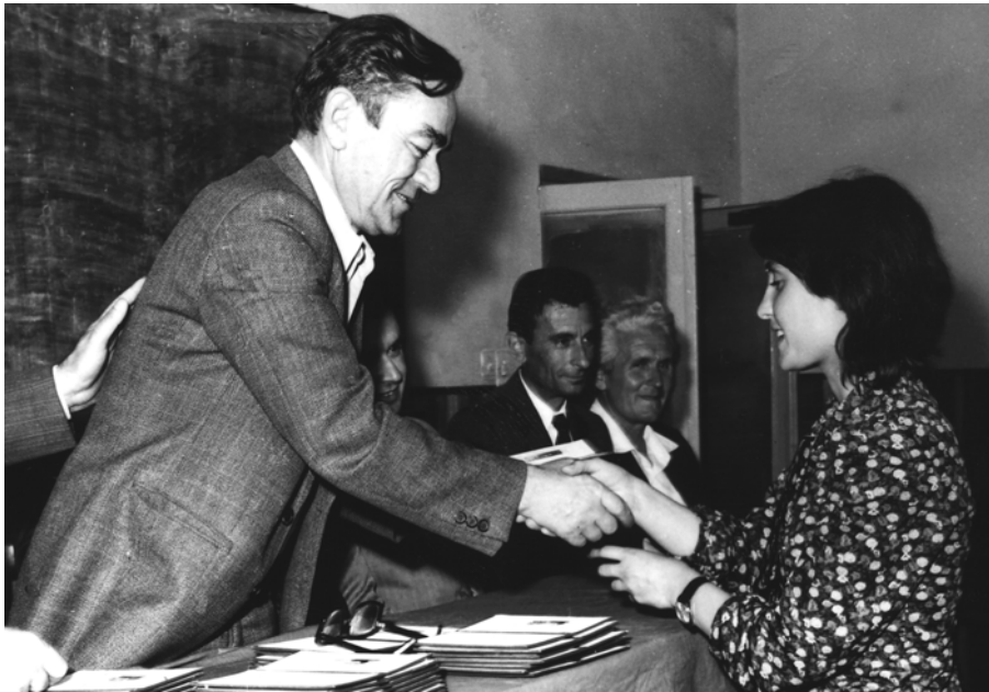
Ceremoni e shërndarjes së diplomave në matematikë, 1985