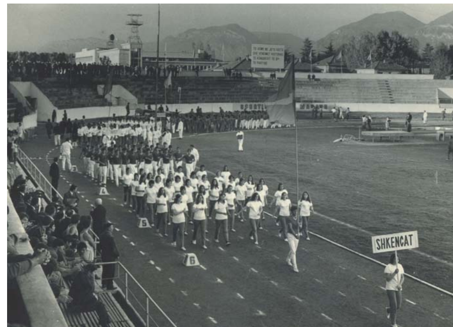
Ceremoni e hapjes së spartakiadës universitare, 1971