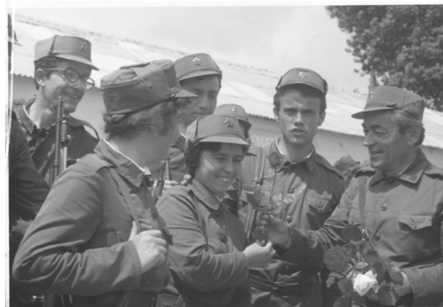
Gjatë stërvitjes ushtarake në Mamurras, 1985