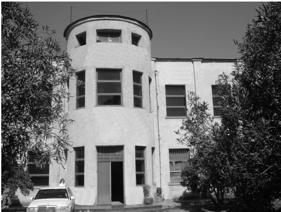
Muzeumi i Shkencave të Natyrës, 2006