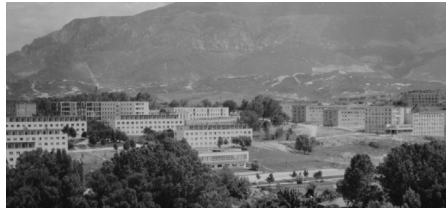
Qyteti Studenti, 1982