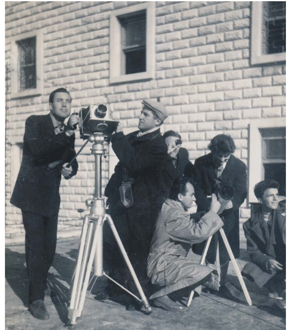
Vëzhgimi i eklipsit të diellit, shkurt 1961