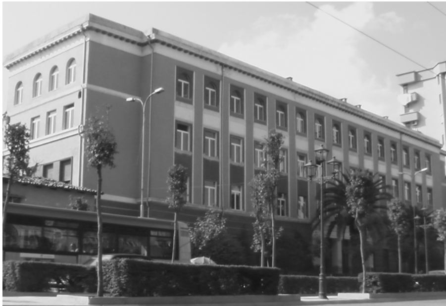
Ndërtesa qendrore e Fakultetit të Shkencave Natyrore, 2006