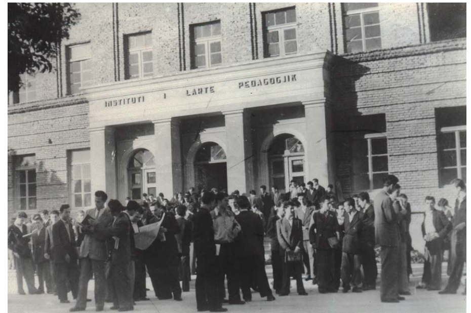
Instituti Pedagogjik (1956), i cili më 1957 u bë selia e Fakultetit të Shkencave Natyrore