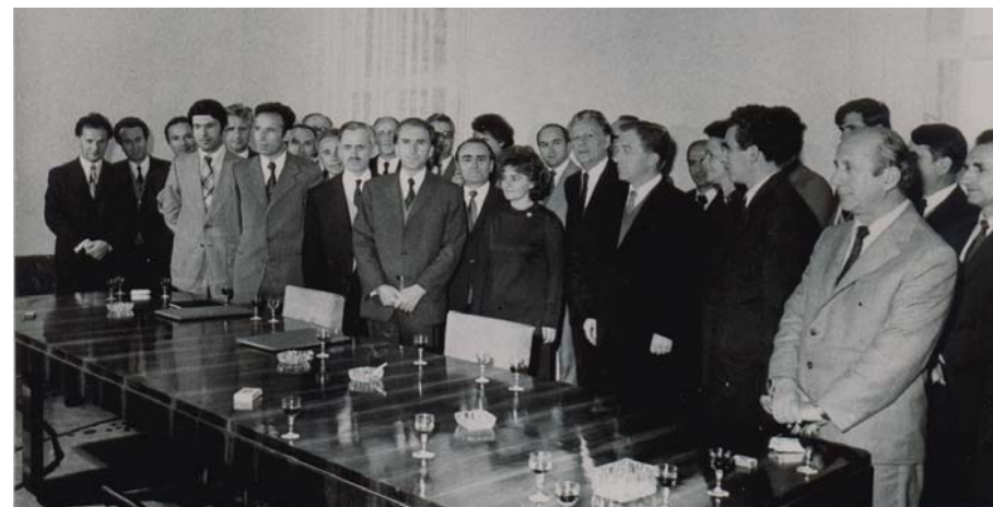
Ceremonia e nënshkrimit të marrëveshjes së bashkëpunimit midis Universitetit Shtetëror të Tiranës dhe Universitetit të Prishtinës, tetor 1974