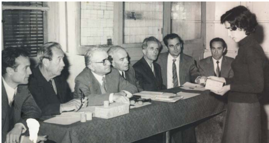
Mbrojtje diplome në Kimi Industriale, 1981